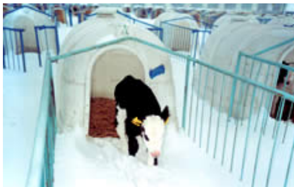
Телета в клетки на снега

Когато се прави сградата трябва да се има предвид, че наистина кравата обича ПРОХЛАДАТА. Температурата, която кравата понася без напрежение е от -20^{\circ}\text{C} до +20^{\circ}\text{C} . При повишаване на температурата над 18^{\circ}\text{C} до 28^{\circ}\text{C} намаляването на млечността може да достигне до 35%, докато при намаляването под -10^{\circ}\text{C} до -20^{\circ}\text{C} намаляването е до 5-7%.